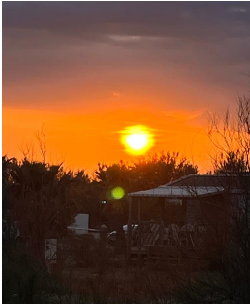
Sonnenuntergang um 20.37 h, 13.05.22 in Palavas les Flots