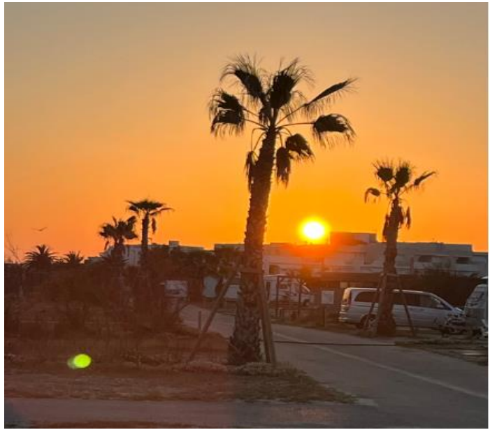
Sonnenaufgang um 06.37 h, 14.05.22 in Palavas les Flots