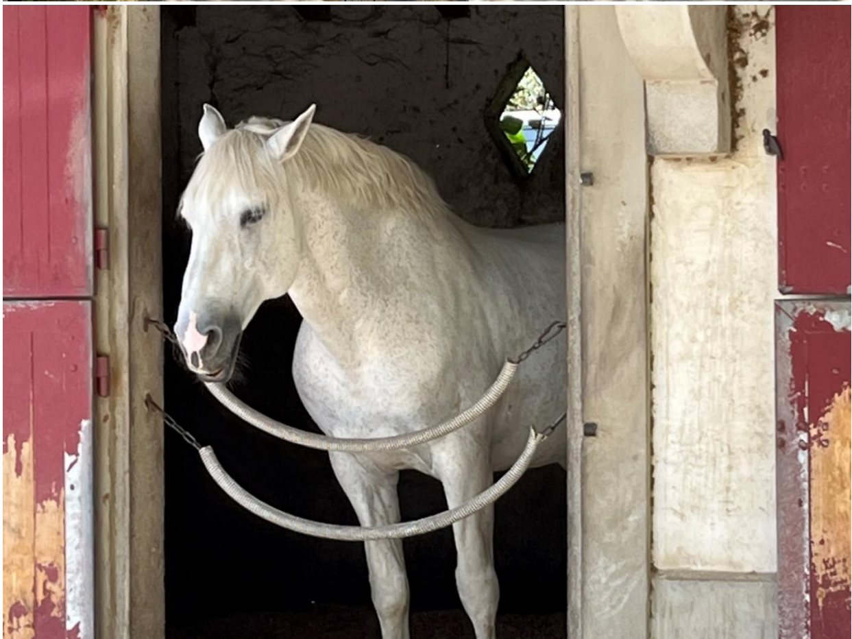
Bilder aus der Camargue